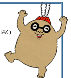
鹿児島市PRキャラクター 「マグニョン」

【メールの場合】 san-monoduku@city.kagoshima.lg.jp